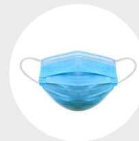
Masque de procédure

Le couvre-visage n'est PAS un équipement de protection approprié au travail. Il peut être porté par les travailleurs en supplément des mesures décrites ci-dessus.